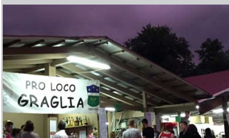
Raduno auto d'epoca e moto