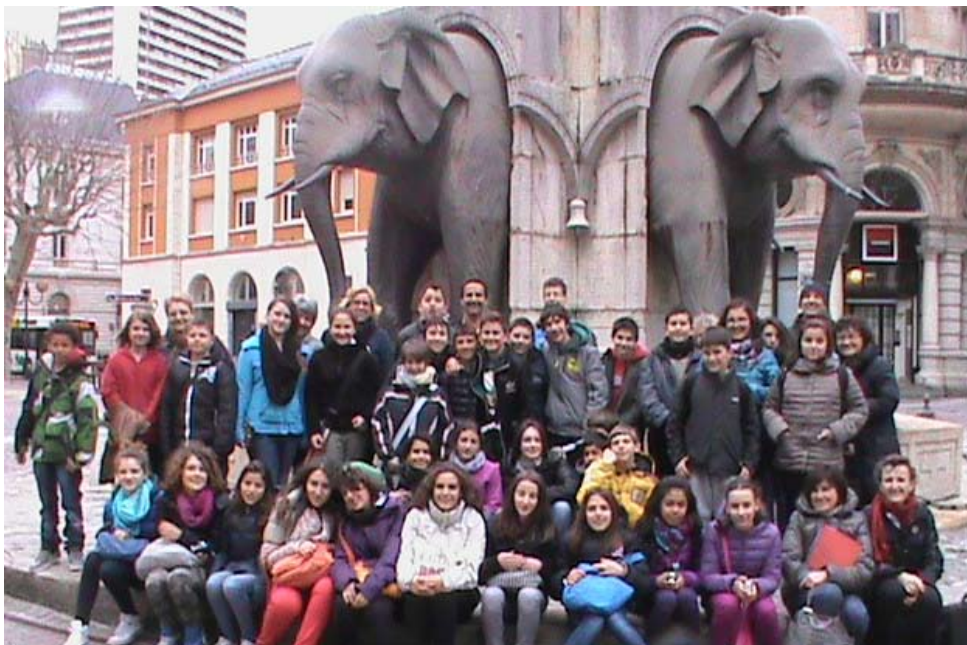
Il monumento degli Elefanti a Chambéry

La giornata seguente si è svolta al College di Côte Rousse con gli allievi che studiano italiano al College ed è terminata con una visita guidata di Chambéry.