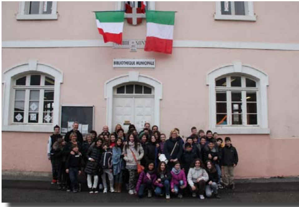
Il gruppo in piazza a Sonnaz