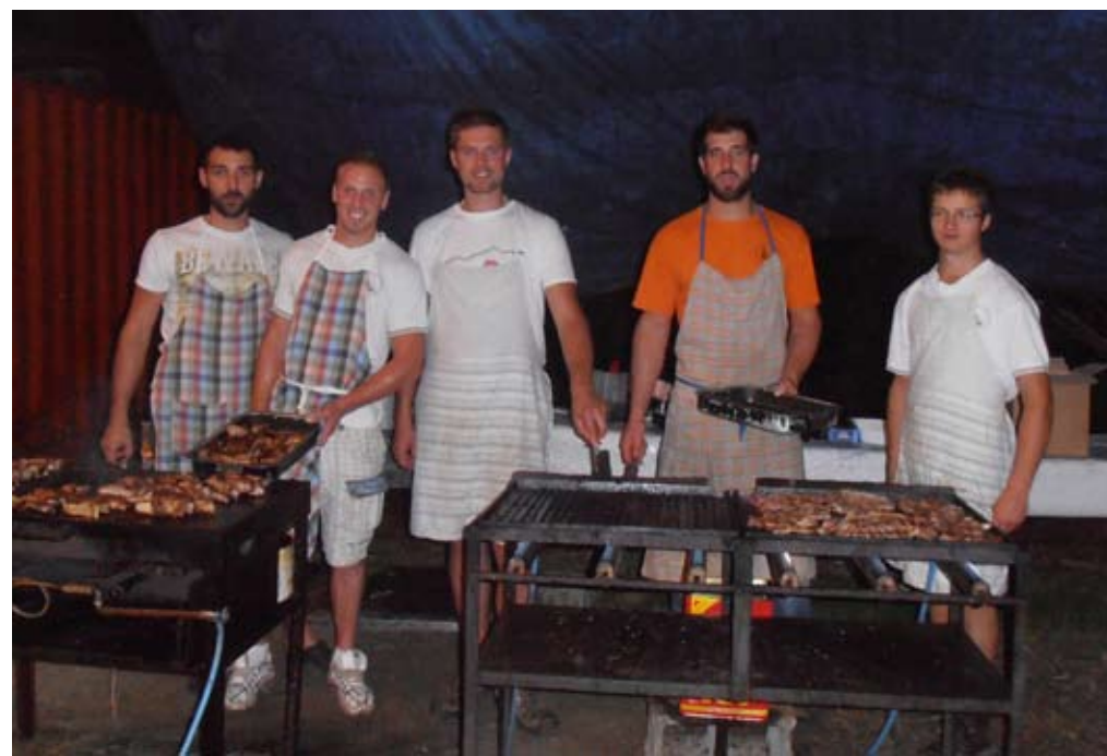
Cena dei collaboratori